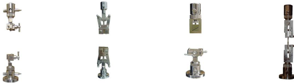
Uchwyt do folii Uchwyt dźwigniowy Uchwyt na odrywanie 90° Uchwyt do testów klejenia