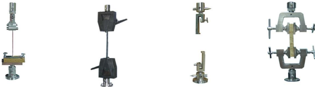
Uchwyt na odrywanie PCB 90° Uchwyt do rozciągania drutów stalowych Uchwyt do ścinania ceramik Annule tensile fixture