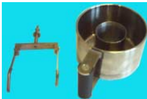
Rys. 2 Komórka pomiarowa – specjalne naczynie pomiarowe i mieszadło z wypustkami