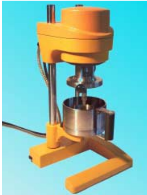
Rys. 1 RHEOTEST RN® RN 4 z komórką pomiarową

Cementu w stosunku masowym woda/cement od 0,3 do 0,6 do Mokrego betonu – zaprawy budowlanej w stosunku masowym piasek/cement od 0 do 3