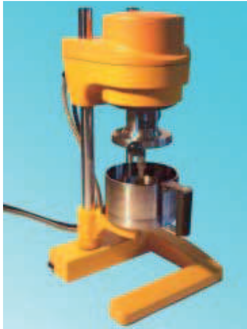
Rys. 1 RHEOTEST RN® RN 4 z komórką pomiarową

Cementu w stosunku masowym woda/cement od 0,3 do 0,6 do Mokrego betonu – zaprawy budowlanej w stosunku masowym piasek/cement od 0 do 3