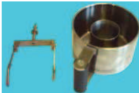
Rys. 2 Komórka pomiarowa – specjalne naczynie pomiarowe i mieszadło z wypustkami